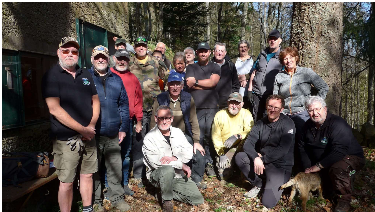
Chantier du 19/04/2026, 22 participants !

Il ne s'agit que d'un extrait, l'intégralité de nos actions étant présentées tant sur Facebook que sur TikTok.