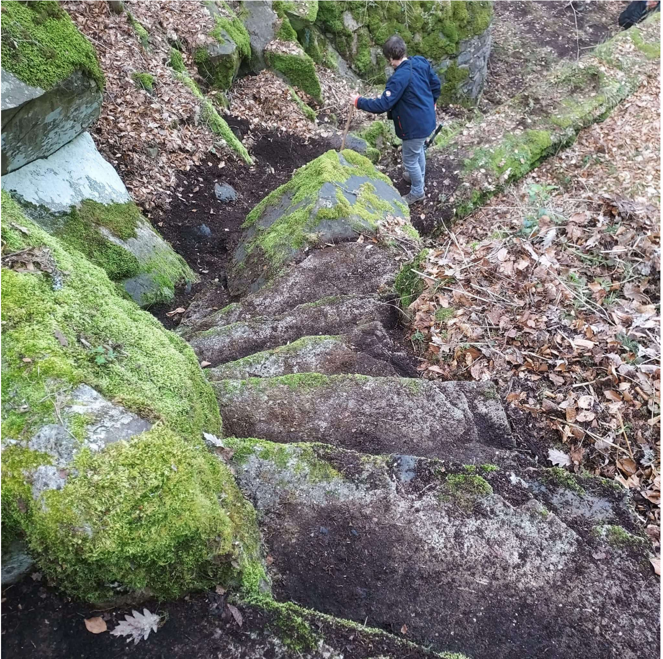
Autre exemple de notre action : nettoyage d'un escalier.