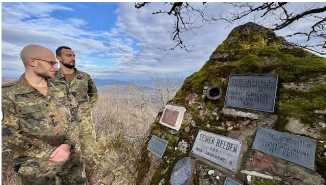
Visites du site par des militaires tant français qu'allemands.