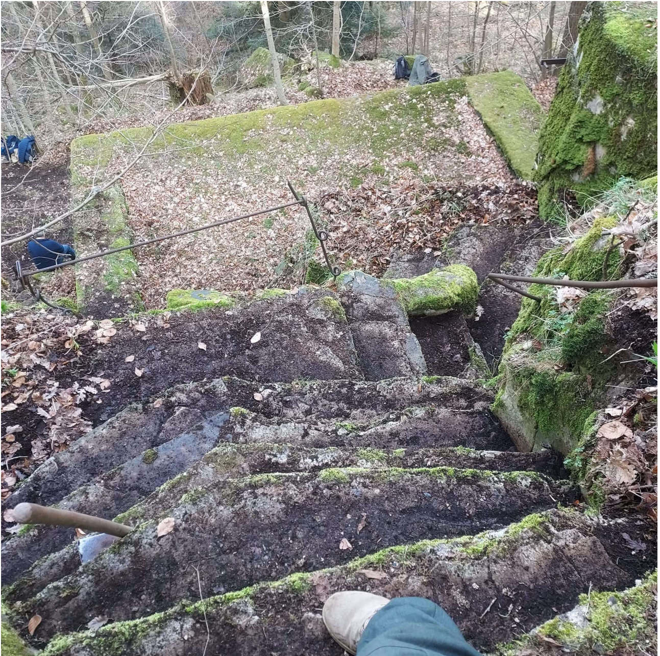
Exemple de nettoyage sur nos itinéraires de visites guidées. Ici, une position de Minenwerfer allemand (type de mortier) dégagée, valorisée et sécurisée par l'association.