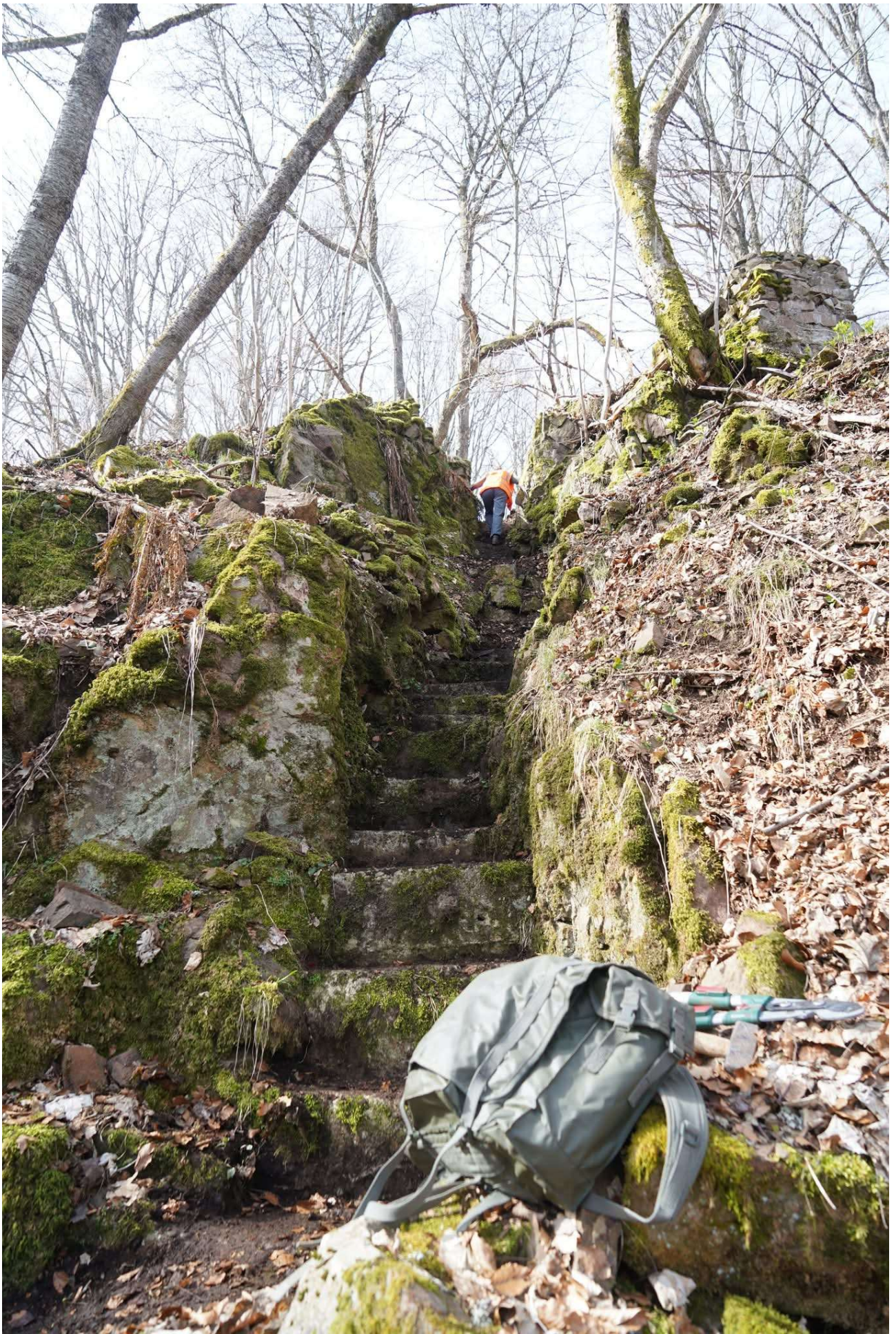
Boyaux d'accès en escalier.