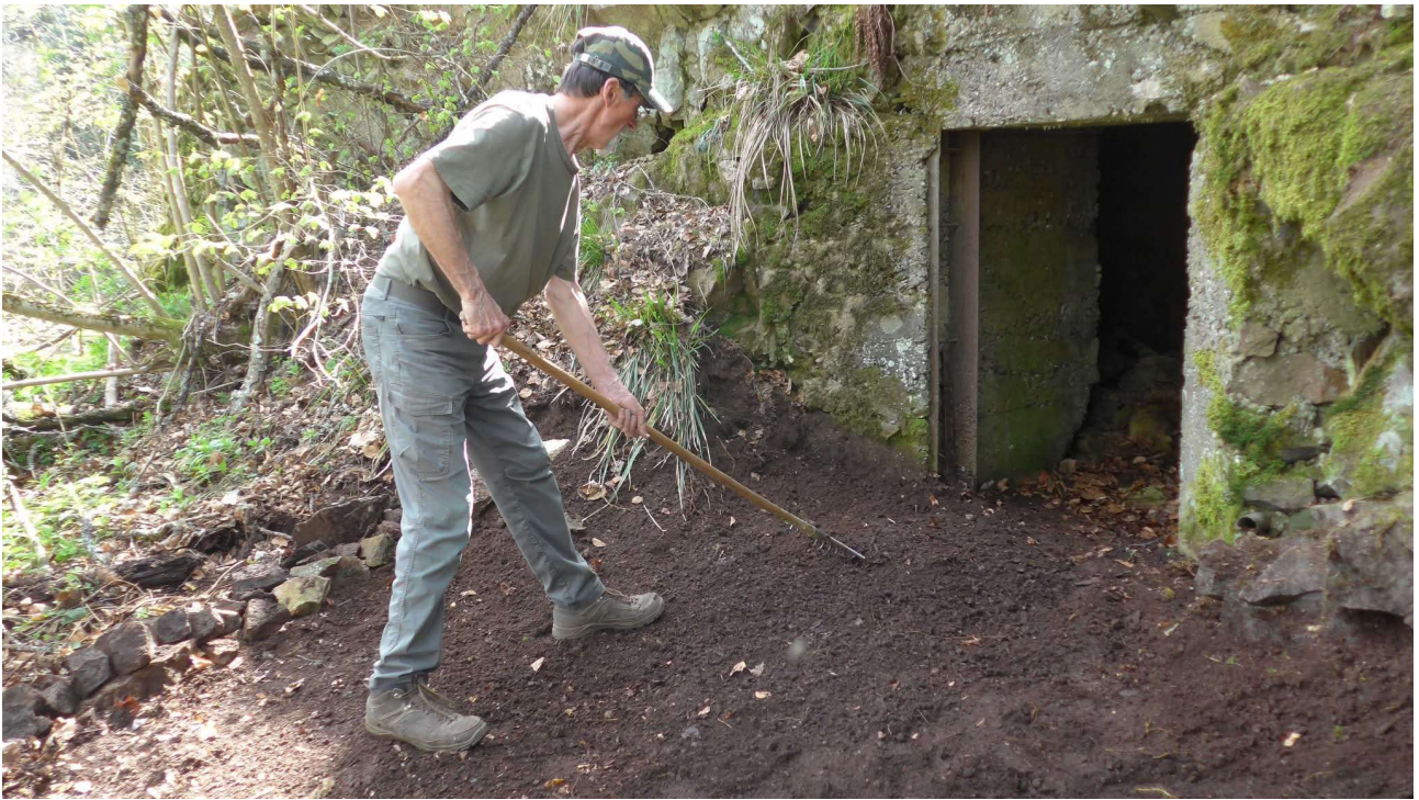
Nettoyage d'entrées de blockhaus de la Grande Guerre, situé le long de sentiers balisés par notre Club.